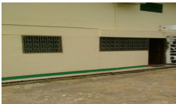
Après- Face d'entrée