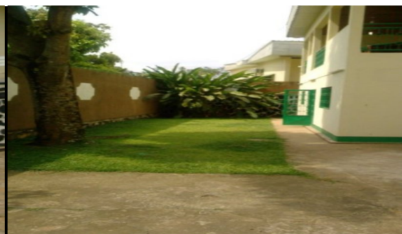
Après - Jardin