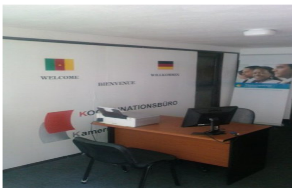
Accueil et secrétariat